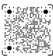
Estares.ru Tik Tok