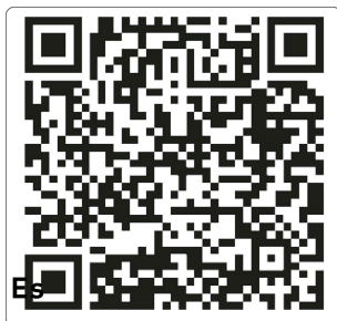
tares Official YouTube