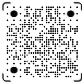
Estares.ru Tik Tok