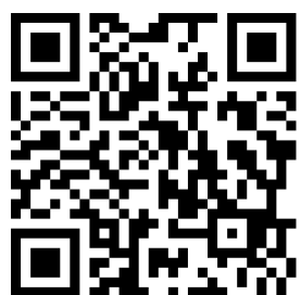
@estares ru .Facebook