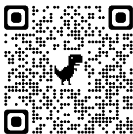
estares ru .

Обзоры светильников, настройка пульта и сборка светильников в instagram и на нашем YouTube канале Estares .