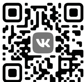
@estares ru VK