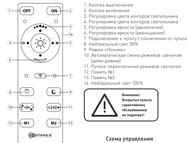
Схема управления с помощью пульта

3.5. Просверлите отверстия и прикрепите монтажную скобу к поверхности.